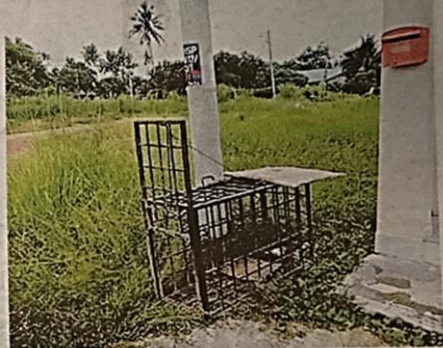
SALAH satu perangkap anjing liar yang dipasang di kawasan perumahan di Taman Semabok Perdana, Melaka semalam.

"Jika ingkar, tindakan boleh diambil di bawah Undang-undang Kecil Pelesenan Anjing. Sabit kesalahan boleh didenda tidak melebihi RM2,000 atau penjara maksimum satu tahun atau kedua-dua sekali," ujarnya.