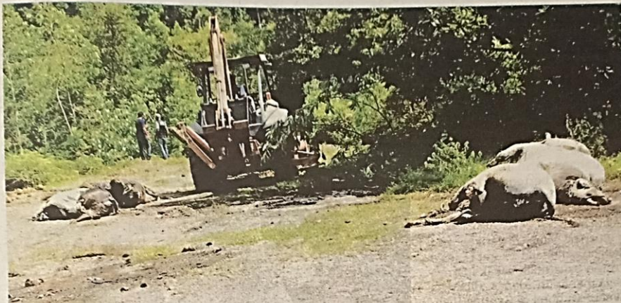
ANGGOTA JPV Terengganu menggunakan jentolak untuk melupuskan 11 bangkai lembu di tapak pelupusan sampah haram di Kampung Sungai Lekar, Kuala Nerus semalam.