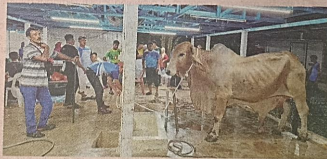
Merah menunggu masa untuk dikorbankan di ladang ternakan di Jalan Sintok, Kubang Pasu.

"Cuma saya yang sebak dan tak sampai hati tengok Merah, sedikit sebanyak saya tetap sedih sebab Merah sangat manja dengan saya," katanya ketika dihubungi di sini pada Rabu.