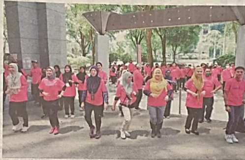
Peserta-peserta tidak melepaskan peluang berzumba sempena program promosi Larian MAHA 2022@ MAEPS, Serdang pada Rabu.

Oleh TUAN BUQHAIRAH TUAN MUHAMAD ADNAN PUTRAJAYA